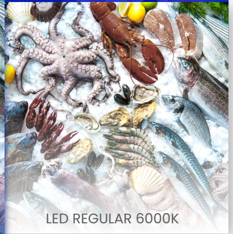
LED REGULAR 6000K